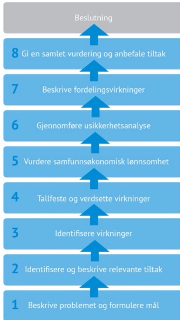
Figur 1.2 De åtte arbeidsfasene